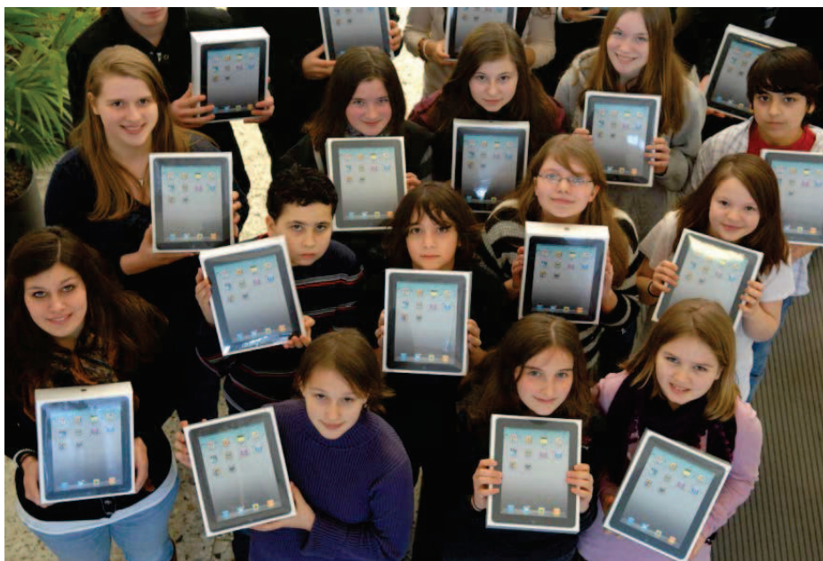
Schülerinnen und Schüler der Kaiserin-Augusta-Schule in Köln mit ihrem iPad